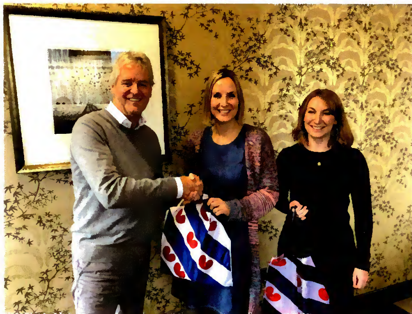
DINGtiid op bezoek in Wales

Leden van bestuur en/of staf hebben hiernaast nog overleggen gevoerd met of vergaderingen bijgewoond van onder andere Mei-inoar foar it Frysk, it Steatekomitee Frysk, Gemeenten&Frysk, de Politike Kommissje (POK) van de Ried fan de Fryske Beweging, Rijksuniversiteit Groningen, Fryske Akademy, Afûk, Tresoar, Europeesk Buro foar Lytse talen, Koninklijke Nederlandse Akademie van Wetenschappen, Rechtbank Noord-Nederland en Gerechtshof Arnhem-Leeuwarden, Gemeente Leeuwarden, Gemeente Waadhoeke, FNP, Vereniging Friese Gemeenten, Stichting Brede Maatskiplike Diskusje, Nationale Dorpentop, Planbureau Fryslân, Joodse School in Amsterdam, Sintrum Frysktalige Berne-opfang, Wy binne mbû, Fierder mei Frysk en Streektaalconferentie Stichting Nederlandse Dialecten.