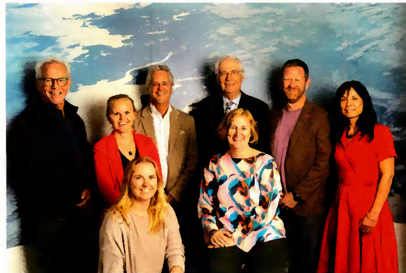
Bestjoer en stêf 2023.

DINGtiid is yn 2022 úteinset mei de jierlikse DINGtiid-lêzing. Yn 2023 binne der foar de gelegenheid twa lêzingen west. De grutte belangstelling foar dizze nije aktiviteit hat derfoar soarge dat nigetawwers fan it Frysk út ferskillende wurkfjilden mei-inoar yn de kunde kaam binne en nije plannen meitsje.