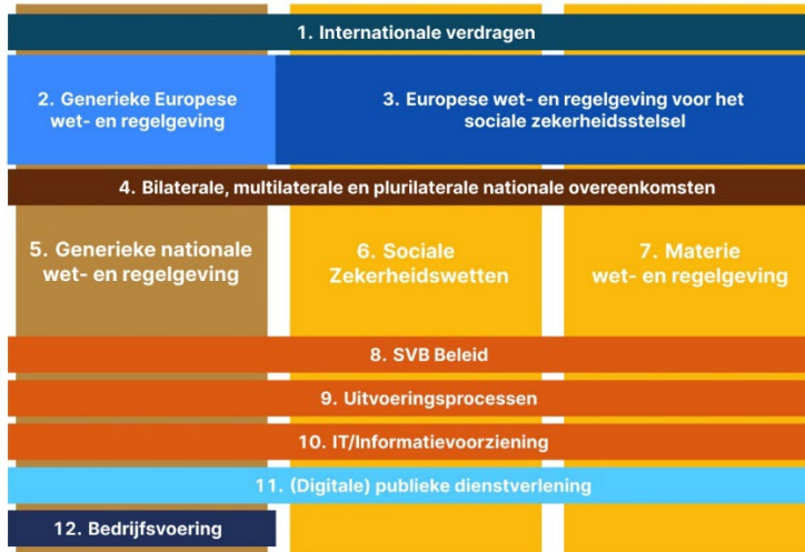
Afbeelding: De SVB werkt aan vereenvoudiging op meerdere niveaus

In 2025 werkt de SVB verder op projectmatige wijze verder aan vereenvoudiging. Er is een vereenvoudigingstool ontwikkeld om projecten ten behoeve van interne vereenvoudiging op een projectmatige manier verder te brengen.