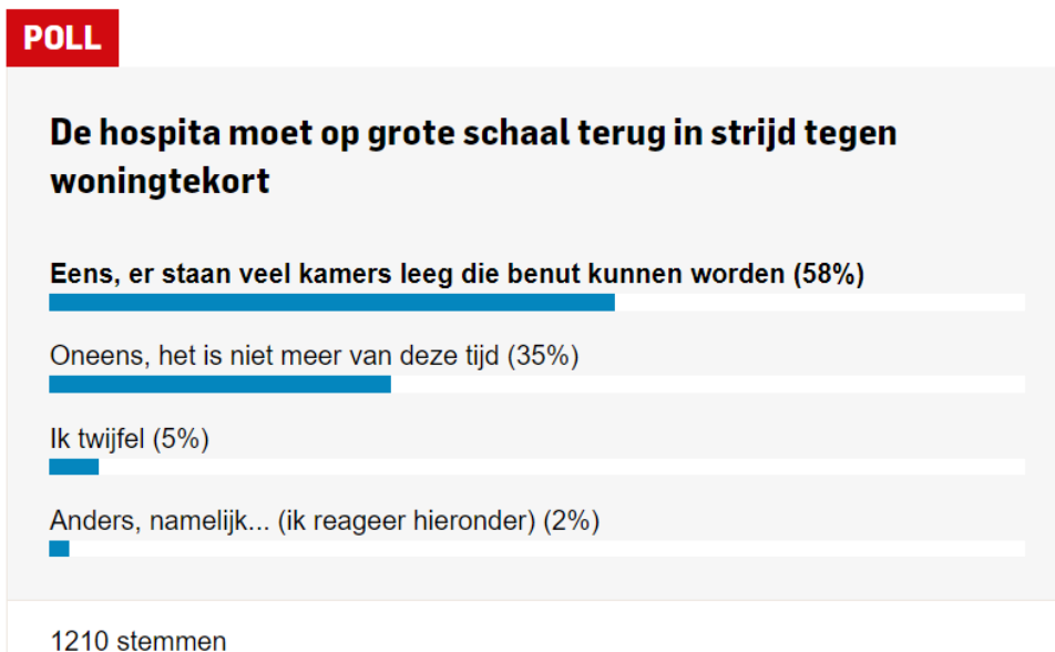
Afbeelding 3 Poll van dagblad De Stentor over hospitaverhuur

Uit het 'Publieksonderzoek hospitaverhuur', in opdracht van het ministerie van BZK (nr. 2.) 43 blijkt dat 29% van de Nederlanders (zeer) positief staat ten opzichte van hospitaverhuur. Eveneens 29% staat er (zeer) negatief tegenover en 36% neutraal. Uit het onderzoek blijkt ook dat een derde van de Nederlanders aangeeft een kamer groter dan 12 m 2 beschikbaar te hebben (eigenaren 40% en huurders 22%). Verder overweegt 8% (waarschijnlijk/zeker) hospitaverhuur. Belangrijkste motieven: extra inkomsten en verlichten van de woningnood.