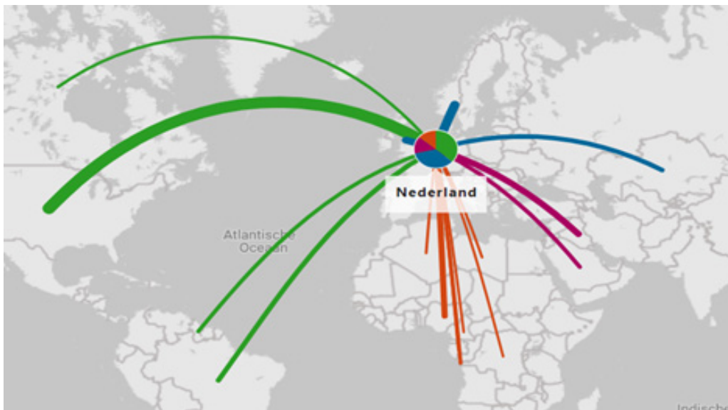
Figuur 2 Importstromen olie naar Nederland 12

Voor olie is Nederland vrijwel geheel afhankelijk van import, voor het overgrote deel van buiten de EU. De invoer van ruwe olie kent daarentegen wel een grote diversiteit aan geografische oorsprong, transportmodaliteit en leveranciers. Belangrijkste herkomstlanden voor olie zijn momenteel onder andere de Verenigde Staten, Noorwegen, het Verenigd Koninkrijk en Irak. De import uit Rusland is de afgelopen tijd snel afgebouwd.