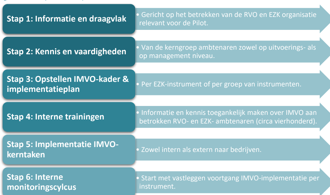
Figuur 2: Aanpak IMVO-pilot

De doelstelling van de pilot was om voor alle geselecteerde instrumenten een werkwijze in te richten om IMVO-kerntaken 1 (informer)en en 2 (adviseren), en voor een beperkt aantal instrumenten ook de IMVO-kerntaken 3 (beoordelen) en 4 (monitoren) toe te passen. Zie bijlage 7.2 voor een uitgebreidere beschrijving van deze IMVO-kerntaken. Onderstaand een beknopte beschrijving van de aanpak van de pilot.