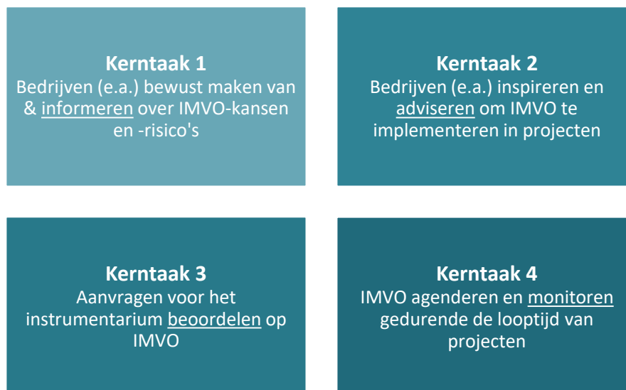
Figuur 1: IMVO Kerntaken van RVO

De doelstelling van de pilot was om voor alle geselecteerde instrumenten een werkwijze in te richten om IMVO-kerntaken 1 (informer)en en 2 (adviseren), en voor een beperkt aantal instrumenten ook de IMVO-kerntaken 3 (beoordelen) en 4 (monitoren) toe te passen. Zie bijlage 7.2 voor een uitgebreidere beschrijving van deze IMVO-kerntaken. Onderstaand een beknopte beschrijving van de aanpak van de pilot.