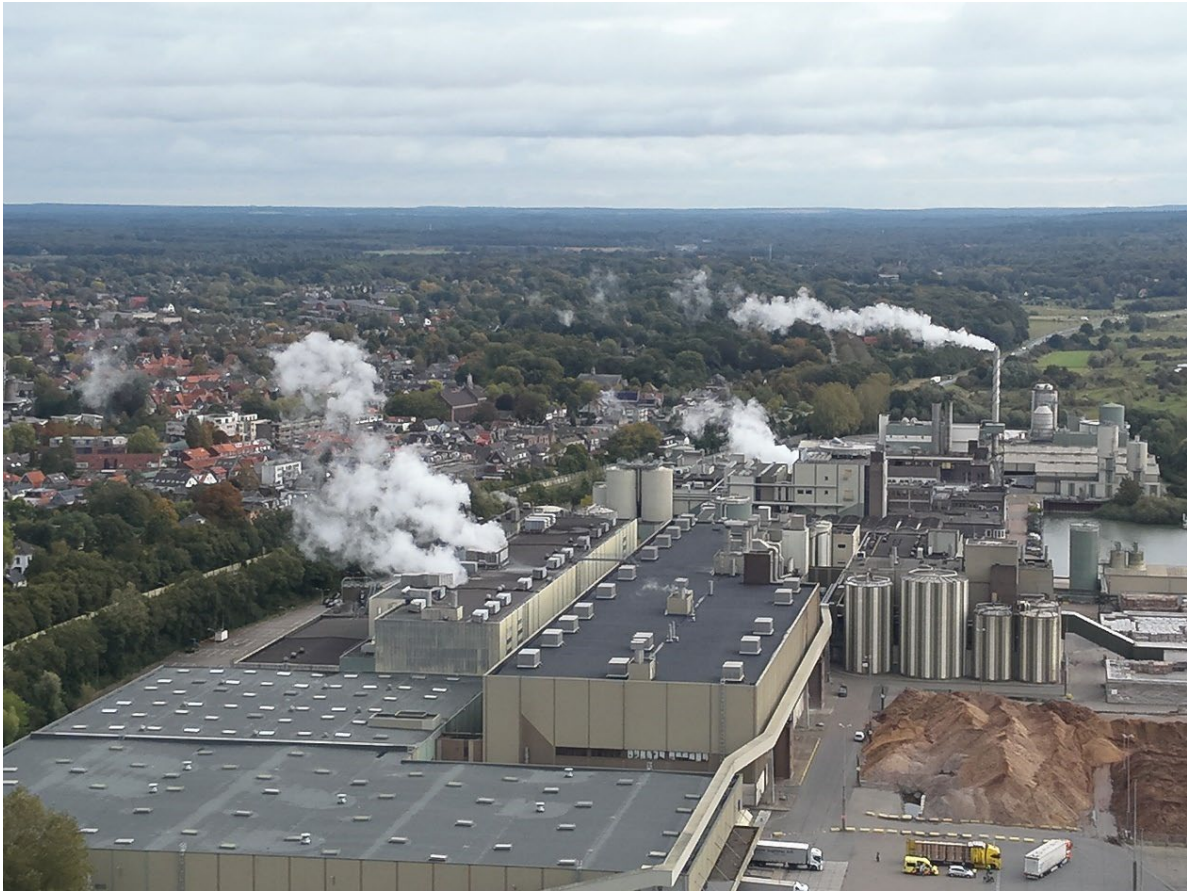
Figuur 4: SKP, met links het dorp Renkum