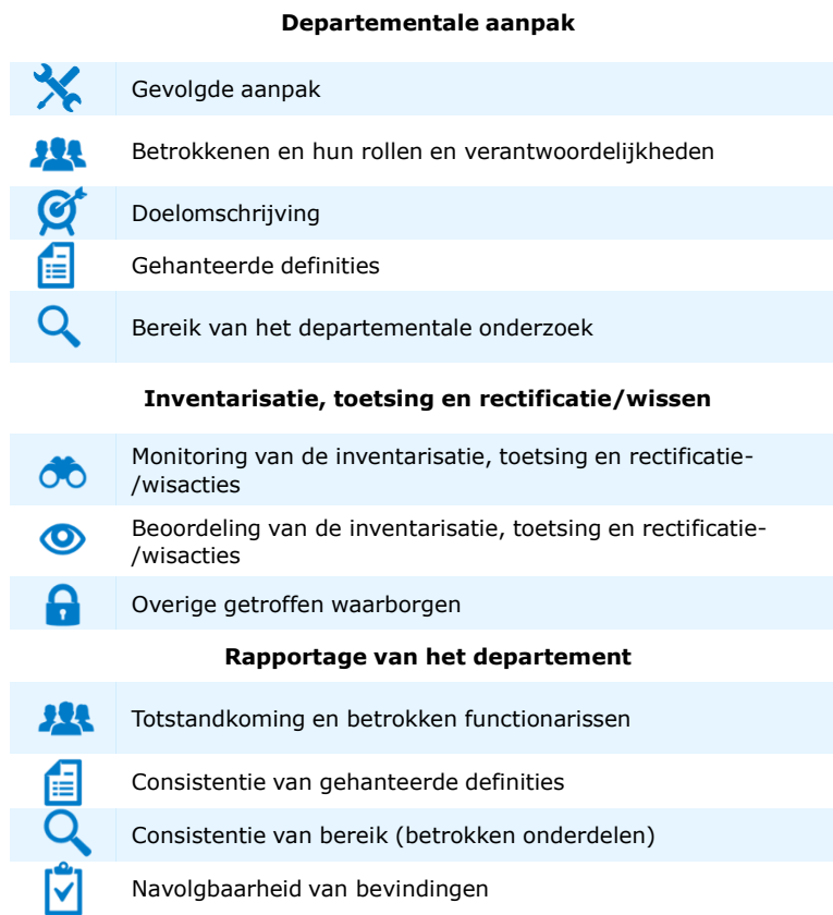
Tabel 4 Onderzochte aspecten