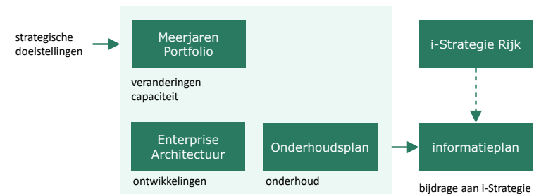
Figuur 1 de samenhang van het informatieplan met andere planproducten

Dit plan geeft inzicht in de doelstellingen, de belangrijkste ontwikkelingen, de plannen en prioriteiten van de Douane op het gebied van de ICT en digitalisering voor de periode 2025-2028. Het vindt haar basis in de Enterprise Architectuur Douane, het onderhoudsplan Douane en het meerjarenportfolio Douane welke al een aantal jaar de basis vormen voor de realisatie van ICT-voorzieningen binnen de Douane. Deze strategische documenten, en nu ook dit informatieplan, worden periodiek geactualiseerd en verbeterd.