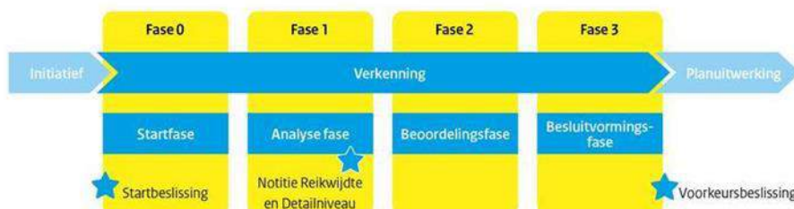
Figuur 4.2 De fasen en beslismomenten van een MIRT-verkenning