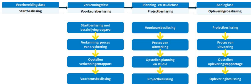
Figuur 4.1 Schematische weergave van het MIRT-proces