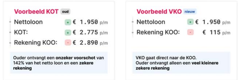
Figuur 2: kinderopvangtoeslag vs. vergoeding kinderopvang

In het nieuwe financieringsstelsel wordt niet meer teruggevorderd bij ouders. Dit is mogelijk doordat het stelsel inkomensonafhankelijk wordt, kinderopvangorganisaties verantwoordelijk worden voor het aanleveren van het aantal opvanguren, de daarbij behorende uurprijs en wijzigingen daarin en doordat de toetsing op de arbeidseis alleen naar de toekomst toe gevolgen heeft. Hierdoor wordt de hoofddoelstelling van het nieuwe stelsel bereikt: een eenvoudig stelsel en meer zekerheid voor ouders.