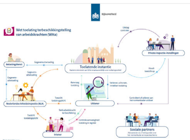
Figuur 2. Praatplaat Wtta

Al met al is het dan ook niet verwonderlijk dat in de vraag van de opdrachtgever aan een potentiële uitvoerder van de Wtta het accent vooral ligt op het opnemen van een organisatie onderdeel dat samenhangende taken uitvoert.