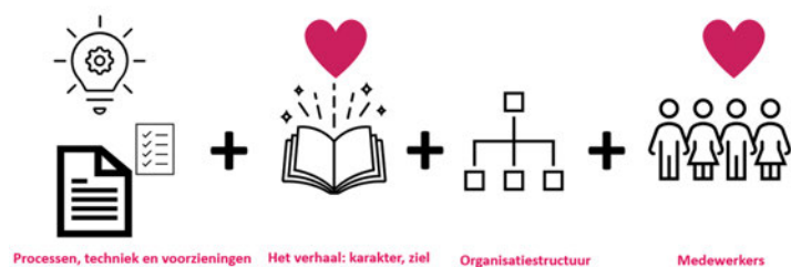
Figuur 1b. Onderdelen van de basisinrichting

Het kwartiermakersteam hanteert het motto ‘‘plug and play’’, dat geeft aan dat de basisinrichting zowel zelfstandig kan bestaan als ‘ingeplugd’ kan worden bij een bestaande organisatie. Daarmee is de aanpak gericht op de toestandbrenging van een TI als totaalpakket inclusief de contacten met externe relevante partijen, zoals inspectie-instellingen. De keuze voor deze aanpak vloeit voort uit: