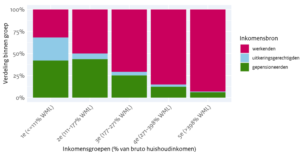
Figuur 1. Verdeling naar inkomensbron over inkomensgroepen