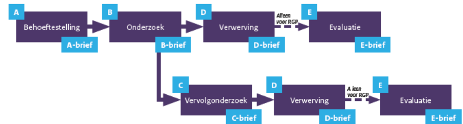
Figuur 1: Processchema DMP

Investeringsprojecten tussen de € 50 miljoen en € 250 miljoen worden na de A-fase gewoonlijk door de staatssecretaris van Defensie gemandateerd aan de ambtelijke organisatie (Kamerstuk 27 830, nr. 379 van 1 november 2022). Mandatering van projecten van meer dan € 250 miljoen is mogelijk in het geval van eenvoudige, weinig risicovolle en politiek niet gevoelige investeringsprojecten met een grotere financiële omvang, of als feitelijk al vast staat hoe de behoefte moet worden vervuld omdat er maar één aanbieder is of weinig aanbieders zijn. Ook is mandatering aan de orde als het gaat om kapitale munitie. Indien een project van meer dan € 250 miljoen wordt gemandateerd, zal de A-brief in ieder geval ingaan op de projectrisico's en het al dan niet voorhanden zijn van verwervingsalternatieven.