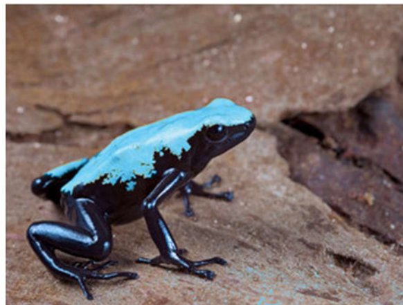
Adelphobates galactonorus blue

Nieuwe lokaliteiten komen dus niet door toeval op de markt. Wanneer door wetenschappelijke onderzoekers een nieuwe soort of lokaliteit wordt ontdekt, bevat het rapport daarover vaak exact de locatie waar de soort of lokaliteit gevonden is. Daarmee hebben smokkelaars, vrijwel altijd afkomstig uit West-Europa de precieze GPS-coördinaten voor hun nieuwe “product”.