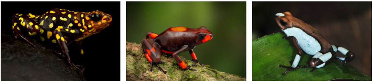
Drie lokaliteiten van één soort: Oophaga histrionica Redhead, Bulls eye en Risaralda

Gifkikkers hebben vaak uiterlijke kenmerken die specifiek zijn voor één specifieke populatie. Zo'n kleurvariant noemt men een lokaliteit. Alhoewel sommige soorten gifkikkers in meerdere landen in het wild voorkomen, kan vaak aan de kleurvariant worden afgeleid uit welk land een dier afkomstig is en of een dier dus legaal kan zijn uitgevoerd of niet. De lokaliteiten hebben vrijwel altijd een naam die ook wordt gebruikt bij de handel in gifkikkers.