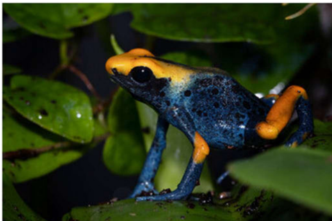
Dendrobates tinctorius tumucumaque