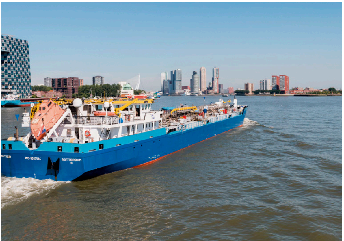
Foto ter illustratie: een binnenvaartschip in Rotterdamse wateren (niet betrokken bij het strafrechtelijk onderzoek)