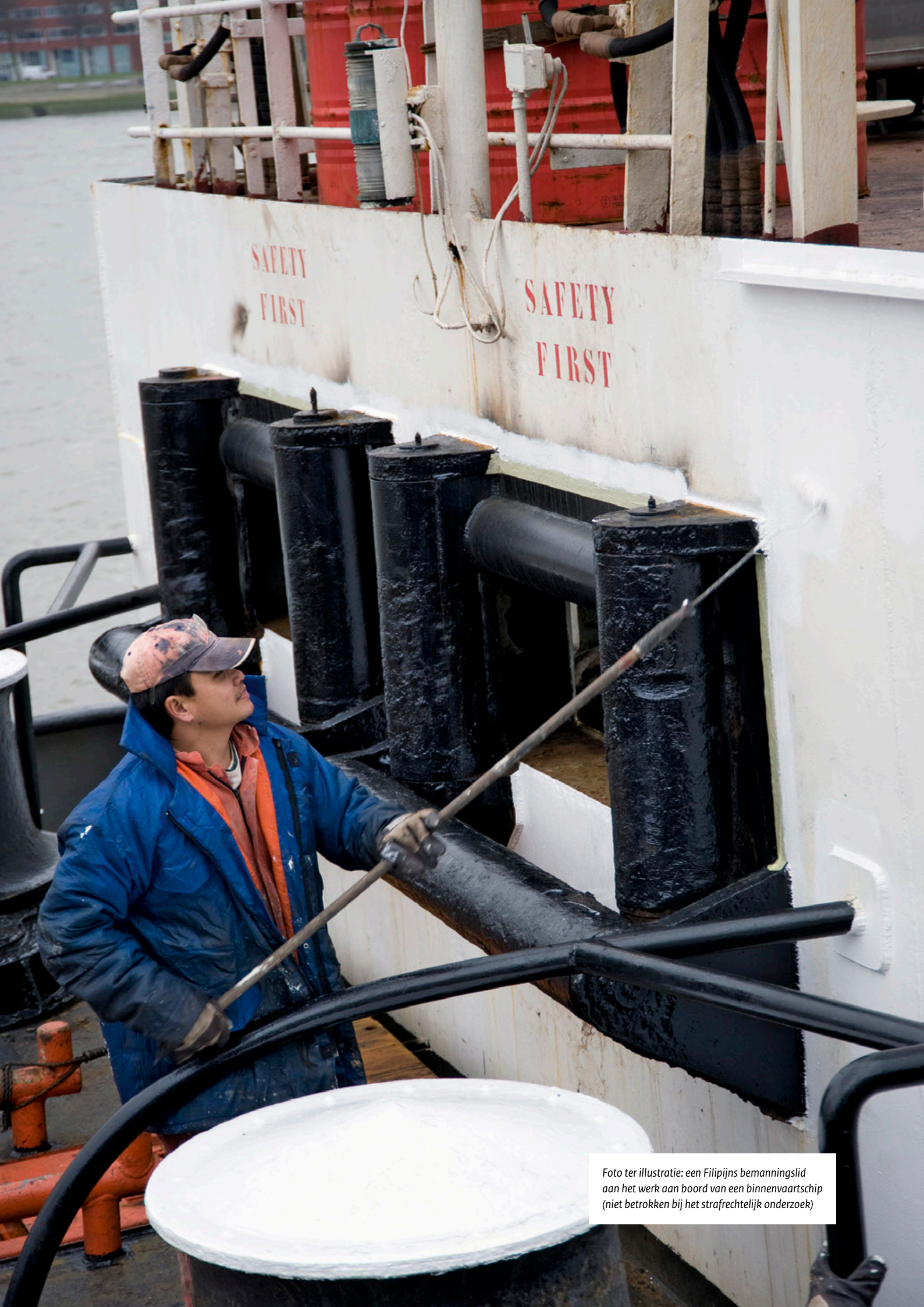
Foto ter illustratie: een Filipijns bemanningslid aan het werk aan boord van een binnenvaartschip (niet betrokken bij het strafrechtelijk onderzoek)