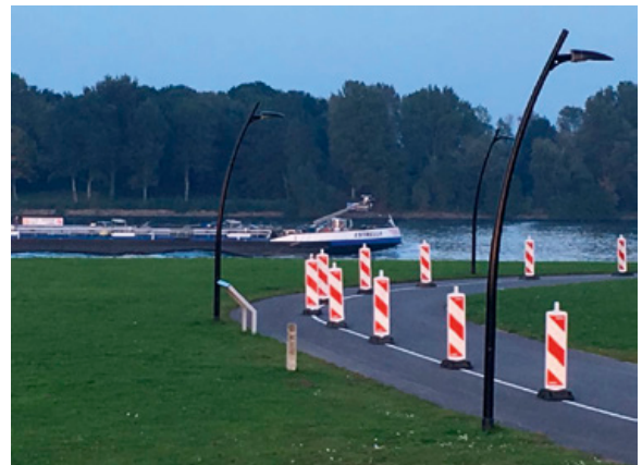
Foto ter illustratie: een binnenvaartschip varend op de oude Maas (niet betrokken bij het strafrechtelijk onderzoek)

Ook hebben de verdachten aan de bemanningsleden kenbaar gemaakt dat bij een (ernstig) ongeval of ziekte, zij zelf voor de medische kosten of doktersbezoek moeten opdraaien. De Filipijnse matrozen worden hierdoor ernstig geremd om medische hulp in te schakelen. Voor hen zijn de medische rekeningen in Nederland enorme bedragen. Uit verhoren met slachtoffers is ook gebleken dat de schipper aan de betreffende matroos heeft verteld dat hij bij fouten zelf zou moeten betalen voor de ontstane schade. Als hij teveel zou klagen, zou hij bovendien het risico lopen om tussentijds teruggestuurd te worden, evenals bij niet functioneren.