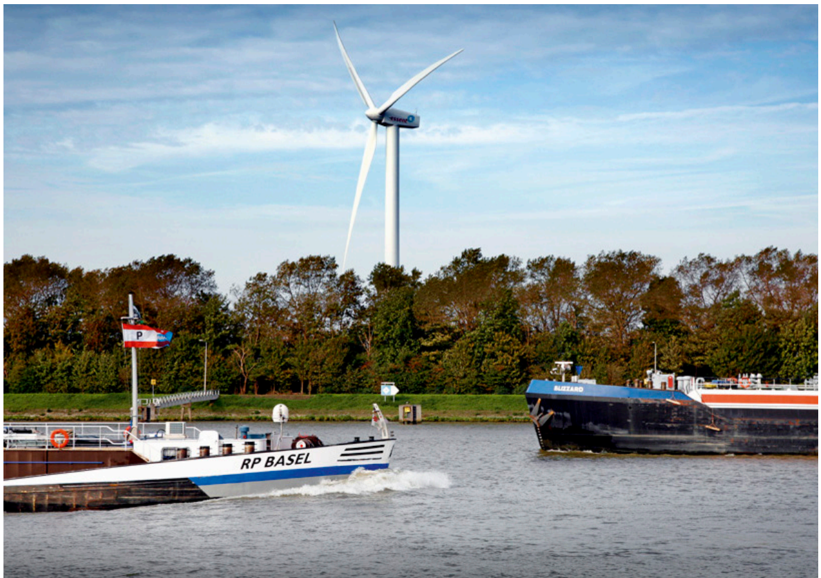
Foto ter illustratie: twee binnenvaartschepen (niet betrokken bij het strafrechtelijk onderzoek)

Er lijkt een leemte te zijn binnen het opleidingsstelsel voor wat betreft het houden van toezicht op het geheel. Er is in het huidige stelsel geen bredere toezichthoudende rol weggelegd voor de drie instanties die betrokken zijn bij het verzorgen van opleidingen, afleggen van examens en verstrekken van vaarbewijzen. Dit maakt dat het stelsel mogelijk fraudegevoelig is. Dit – het verstrekken van stickers zonder controle op het daadwerkelijk volgen en met goed gevolg afronden van de opleiding (examen) - is een wezenlijk onderdeel gebleken in het tewerkstellingsproces dat uiteindelijk heeft geleid tot de arbeidsuitbuiting van Filipijnse matrozen in de Nederlandse binnenvaart.