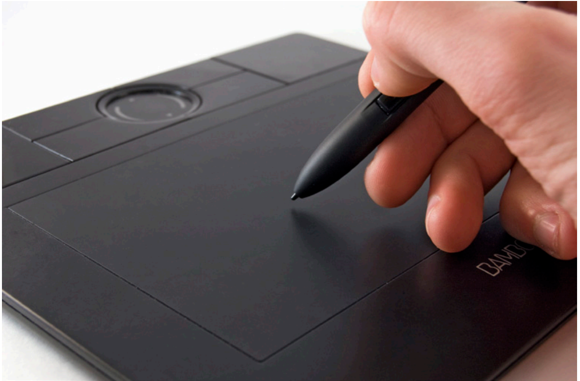
Een digitaal tekentablet