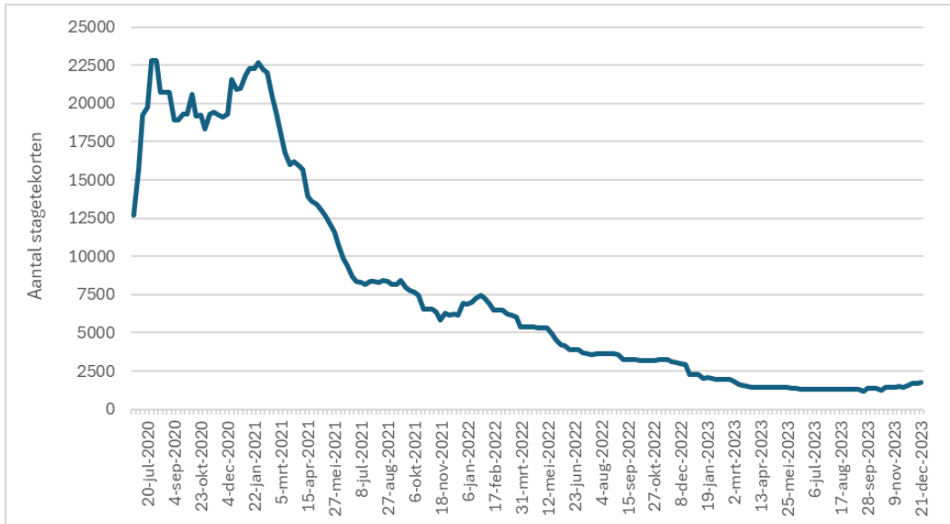
Figuur 1. Ontwikkeling van tekorten aan stages en leerbanen van 10 juni 2020 tot en met 31 december 2023 1

In juli 2020 werd het hoogste aantal absolute tekorten gemeten, met in totaal een tekort van 22.803 stageplekken en leerbanen, gevolgd door een piek van 22.678 tekorten eind januari 2021. Vanaf februari 2021 namen de tekorten gestaag af. Deze daling valt samen met de versoepelingen van de coronamaatregelen. Met de steeds verdere versoepeling van de coronamaatregelen en de intensieve samenwerking tussen leerbedrijven, onderwijsinstellingen en SBB bij de aanpak van tekorten zagen we het aantal tekorten tussen maart 2021 en juli 2021 sterk dalen.