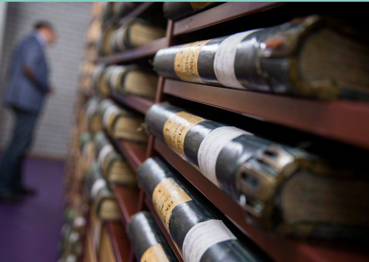
Foto: Historische boeken in een archief.