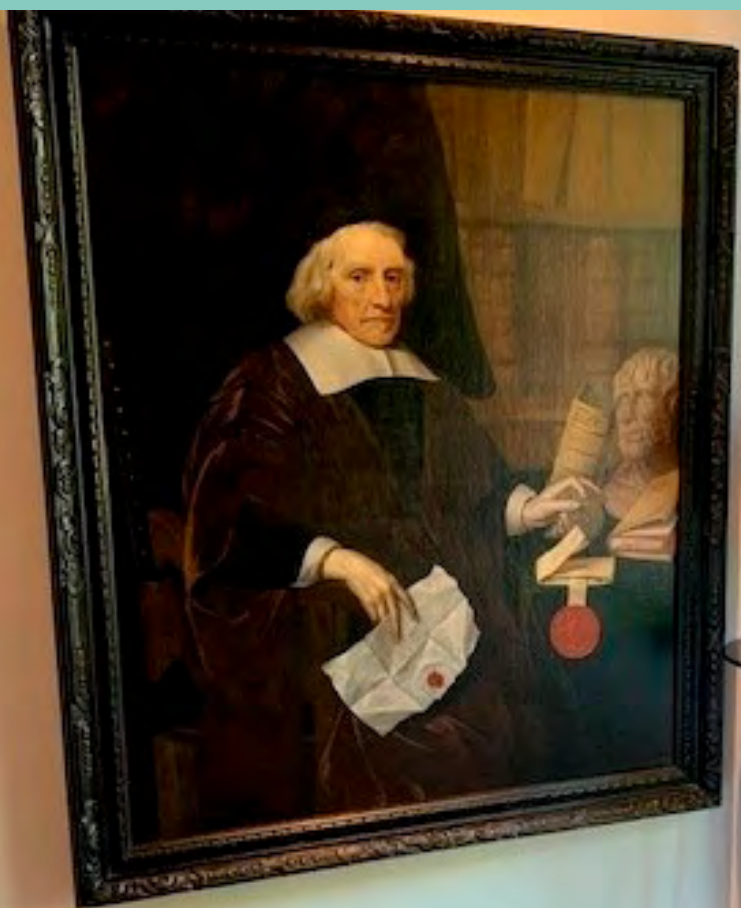
Foto: Schilderij uit de collectie in het Catshuis.