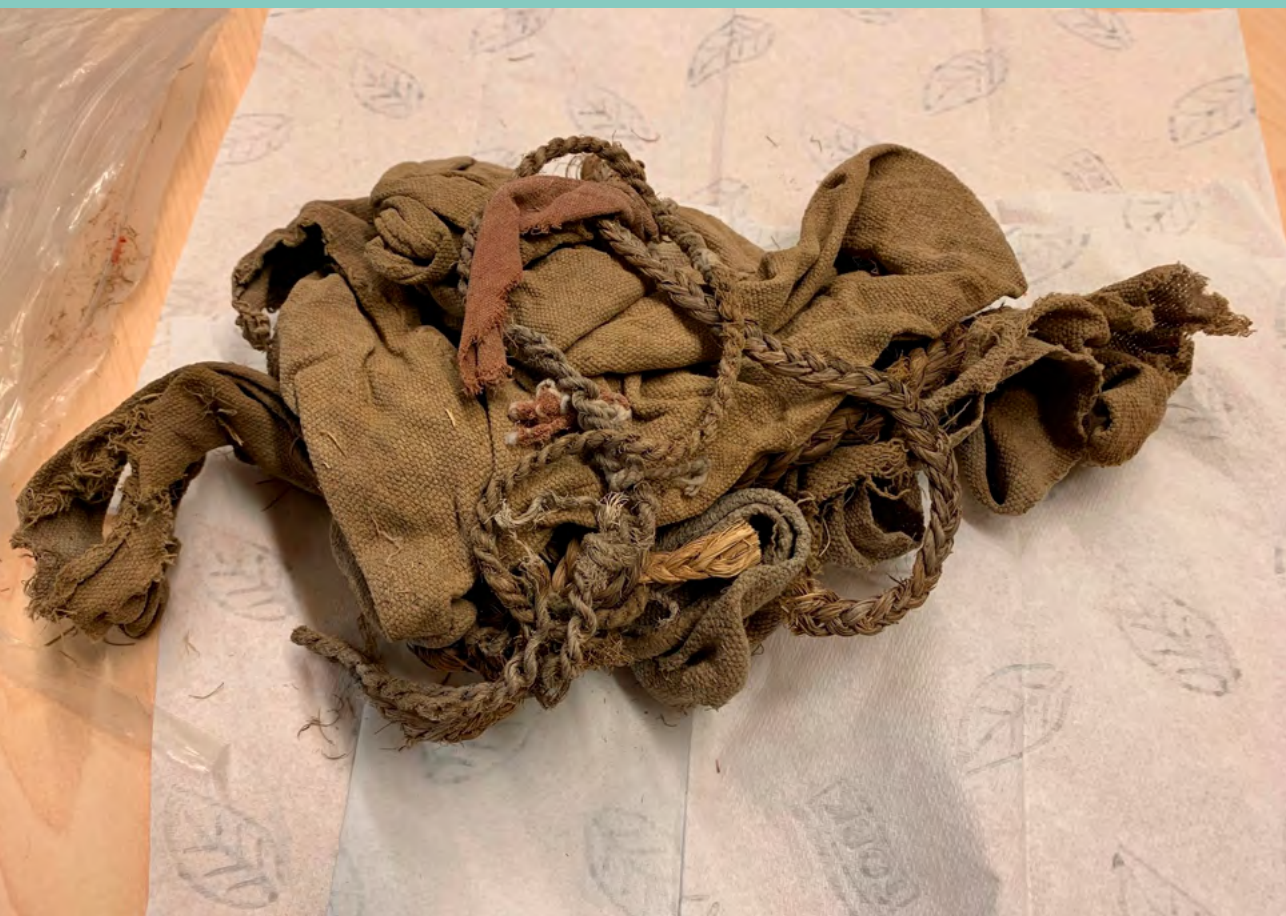
Foto: Peruaanse lijkwade bestaande uit fragmenten van textiel en touw.