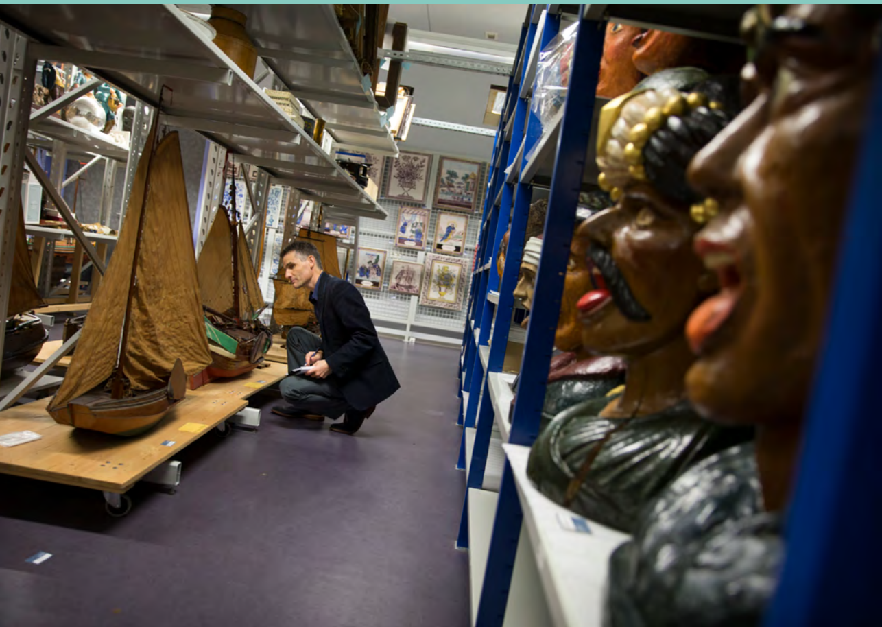
Foto: Inspectie van de Rijkscollectie in het Zuiderzeemuseum in Enkhuizen.