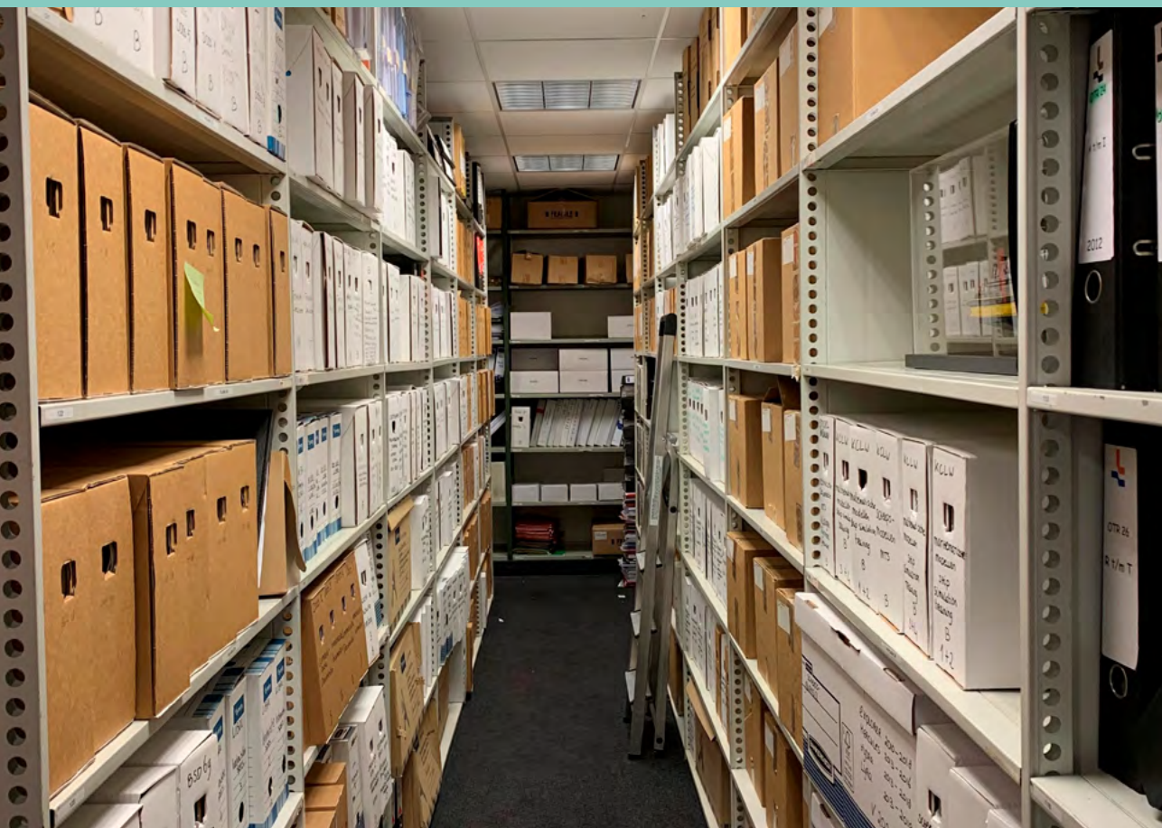
Foto: Archief ruimte in het kantoor van het Loodswezen in Hoek van Holland.