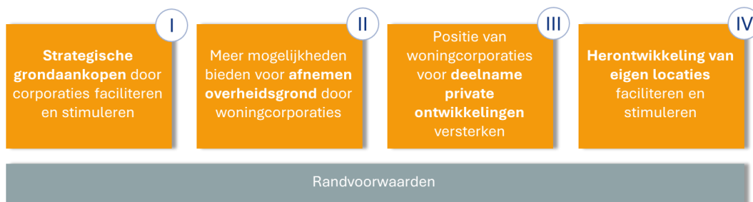
Figuur 3 Vier beleidsalternatieven gerelateerd aan de strategieën om sociale huurwoningen te realiseren