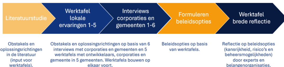
Figuur 1 Onderzoeksofzet

Allereerst is een literatuurstudie gedaan om verder inzicht in de problematiek, argumentatie en oplossingsrichtingen die al genoemd of onderzocht zijn te krijgen. De referentielijst is te vinden in Bijlage 2.