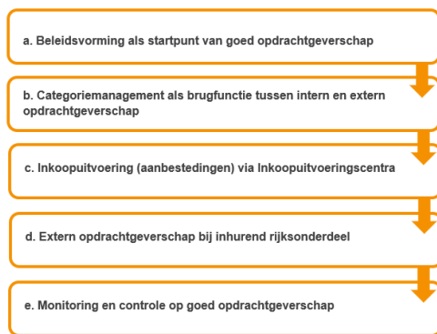
Figuur 3. Vijf stadia in goed opdrachtgeverschap Rijk