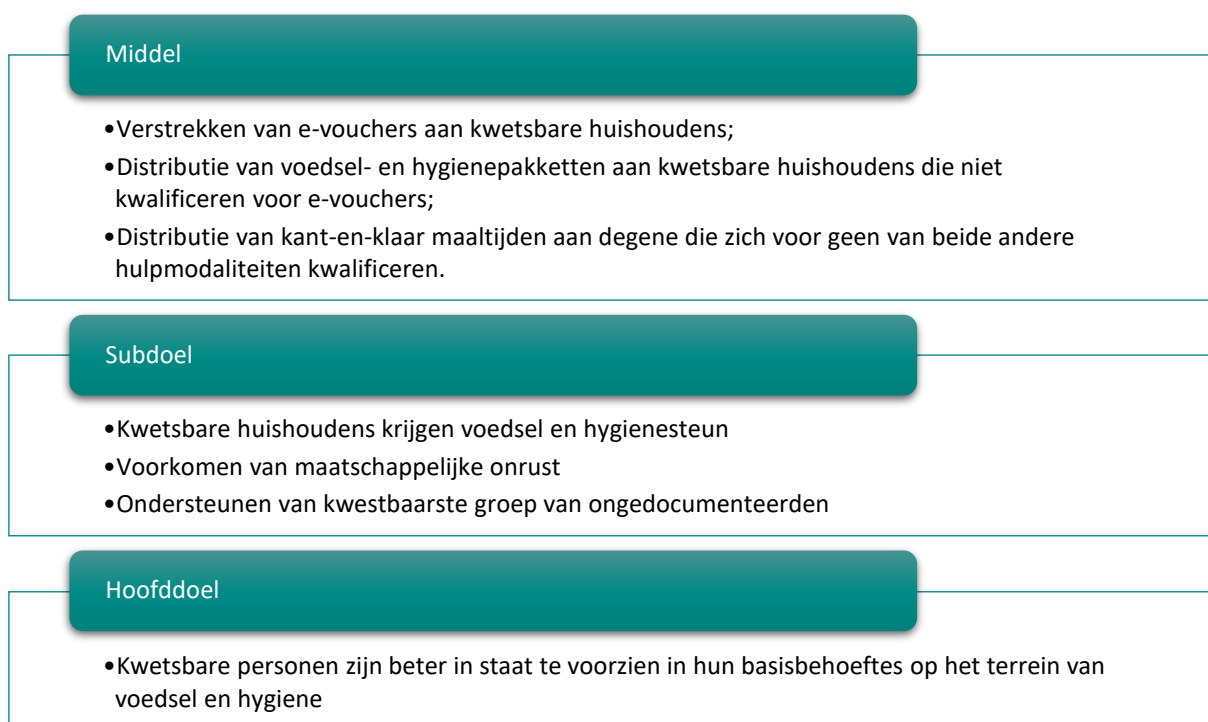
Figuur 5.1: Beleidslogica noodsteun CAS-landen