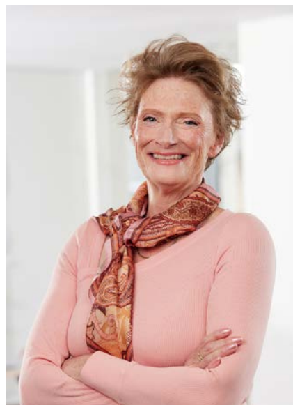
Alida Oppers Inspecteur-generaal van het Onderwijs

In De Staat van het Onderwijs schrijven we elk jaar over de kwaliteit van het onderwijs in Nederland. In dit jaarverslag verantwoorden we ons eigen werk in het afgelopen jaar. Dit doen we in de vorm van een beschrijving van de grote ontwikkelingen in ons toezicht, een overzicht van onze stelselonderzoeken en aantallen onderzoeken bij scholen en opleidingen en besturen.