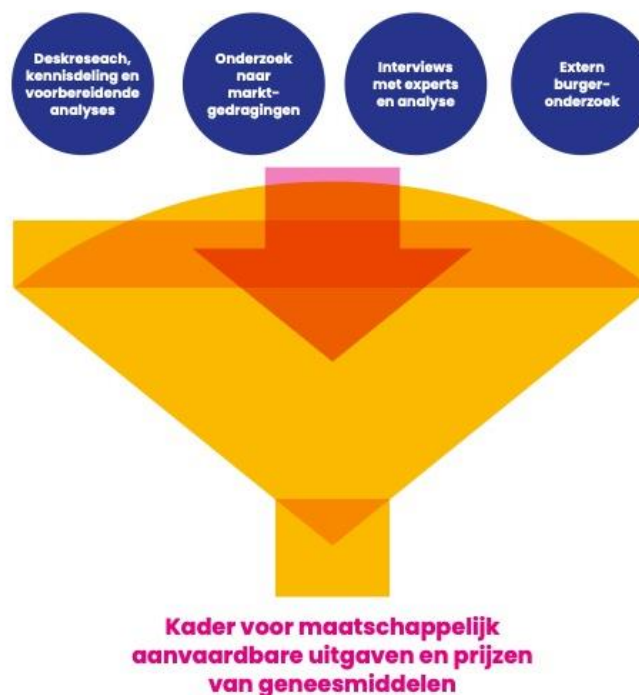
Figuur 2: Deelresultaten vormen input voor het op te stellen kader

De eigen analyses en de drie deelresultaten worden door de programmapartijen gebruikt voor het opstellen van het advies over het kader voor maatschappelijk aanvaardbare prijzen van en uitgaven aan geneesmiddelen. Dat zal bestaan uit 'elementen', een meetlat en een weging. Elementen zijn de grootheden (factoren) die een rol spelen in de besluitvorming. De meetlat bestaat uit een of meerdere kwantitatieve normen waartegen de elementen, voor zover mogelijk, kunnen worden afgezet. De weging is ten slotte een integrale beschouwing die inzicht geeft in wat maatschappelijk aanvaardbare uitgaven aan en prijzen van geneesmiddelen zijn.