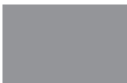
Han Polman Voorzitter Raad voor het Openbaar Bestuur

De inhoud van het advies komt geheel en al voor rekening van de ROB, met dank aan de gezamenlijke inzet en het gedeelde commitment van alle hiervoor genoemde betrokkenen. De ROB hoopt dat alle partijen eenzelfde gezamenlijkheid aan de dag leggen bij de uitvoering van het klimaat- en energiebeleid. Deze inzet is namelijk meer dan ooit geboden om de nationale doelstelling van 55% CO 2 -reductie in 2030 veilig te stellen. Aan de slag! Hopelijk luiden de nieuwsberichten in 2030 dan: ‘Decentrale overheden liggen goed op schema bij de uitvoering van het klimaat- en energiebeleid’.