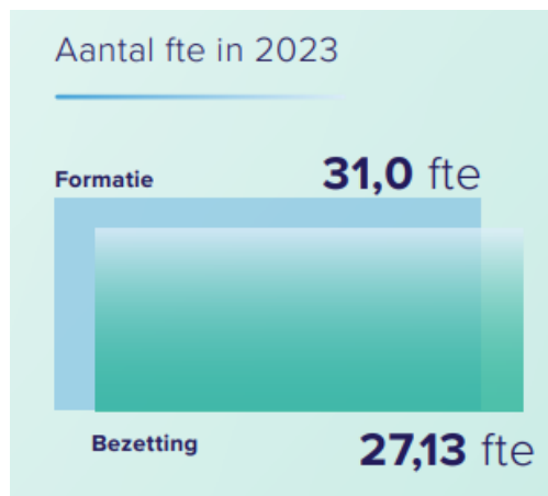
Figuur 2. Formatie en bezetting Huis voor Klokkenuiders in 2023 12

Naast het bestuur, heeft het Huis ook een directeur. Deze is verantwoordelijk voor de dagelijkse leiding van het Huis en geeft leiding aan een bureau van 27,13 fte. Onder dit bureau vallen de medewerkers van de verschillende afdelingen van het Huis. De directeur is in dienst van het Huis. Onderstaande figuur laat zien dat van de totale formatie van 31 fte in 2023 3,87 fte bestond uit nog niet vervulde vacatures. 11