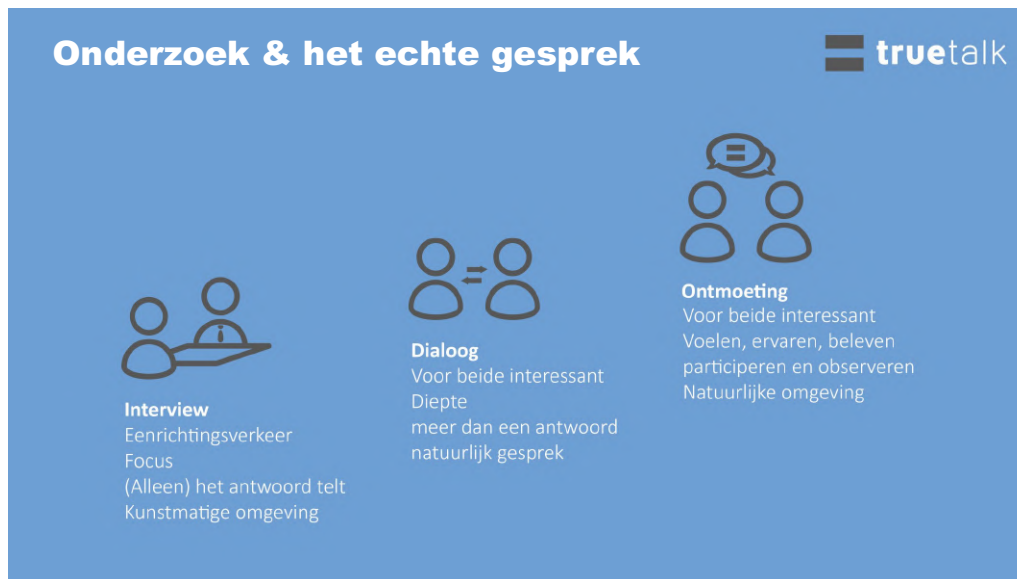
Figuur 1: Verschillen tussen interview en dialoog

Een diverse groep gesprekspartners betekent ruimte voor uiteenlopende verhalen en ervaringen. TrueTalk koos daarom voor de open dialoogvorm in plaats van strakke interviews. In een dialoogvorm kan iedereen die iets wil zeggen over het onderwerp namelijk daadwerkelijk zeggen wat hij of zij kwijt wil. Zo kan men tot een echt en natuurlijk gesprek te komen en het echte verhaal horen. Daarnaast geeft een dialoog de mogelijkheid om door te vragen op wat gesprekspartners vertellen en de diepte in te gaan. Bij interviews is de vragenlijst leidend en is er geen tot weinig ruimte om mee te kunnen bewegen met onderwerpen die voor de gesprekspartners belangrijk zijn.