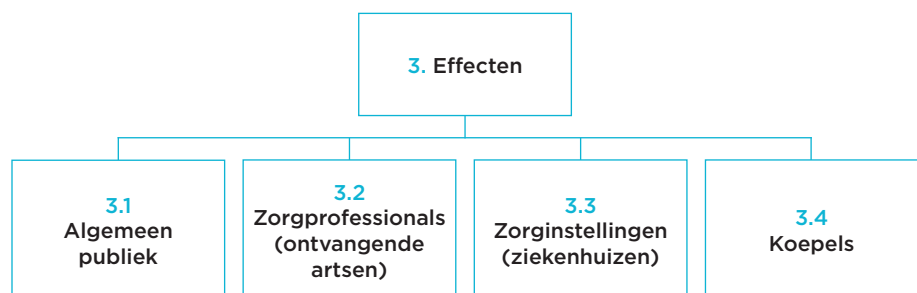
Figuur 3.1 Opzet deelonderzoeken effecten

In het onderzoek naar de effecten van het TRZ maakt het IVM gebruik van vragenlijsten en interviews. In de volgende paragrafen zijn de onderzoeken per doelgroep uitgewerkt.