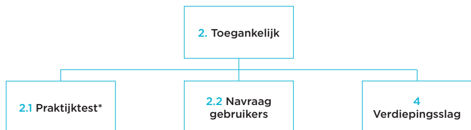
Figuur 2.1 Opzet deelonderzoeken doeltreffendheid (toegankelijkheid)

* Dit onderdeel vindt alleen plaats als de website van het TRZ in vorm of functionaliteit wordt gewijzigd voor 1 augustus 2023.