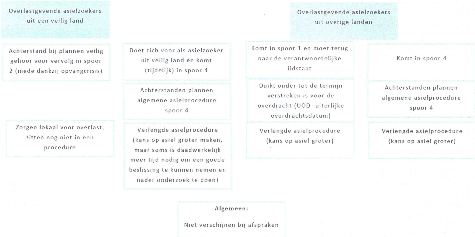
Figuur 2: voorbeelden van verschillende routes om de asielprocedure te vertragen