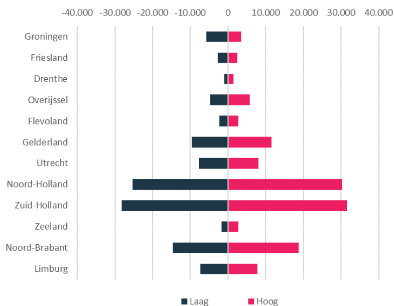
Figuur 3.1: Afwijking ten opzichte van Trendprognose in verwachte ontwikkeling aantal huishoudens naar provincie in varianten Laag en Hoog, 2023-2031; bron: Primos 2023 Trend, Laag en Hoog

In absolute aantallen lopen de resultaten naar provincie nogal uiteen. Het verschil in huishoudens in 2031 in de provincie Zuid-Holland bedraagt 32.000 meer in Hoog dan in de Trendprognose, c.q. 28.000 minder in Laag dan in de Trendprognose. Voor de provincie Drenthe daarentegen is het verschil tussen de Trendprognose en beide varianten 1.000 (Laag) en 1.500 (Hoog) huishoudens.