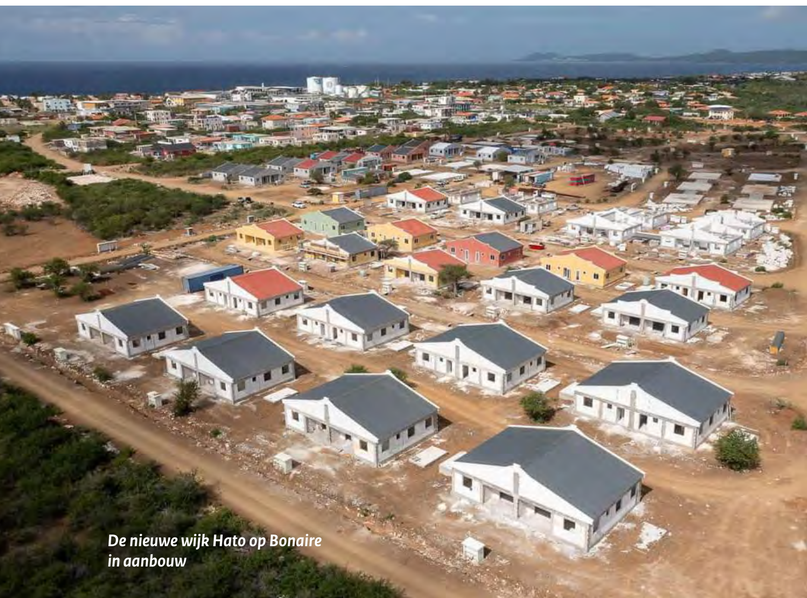
De nieuwe wijk Hato op Bonaire in aanbouw