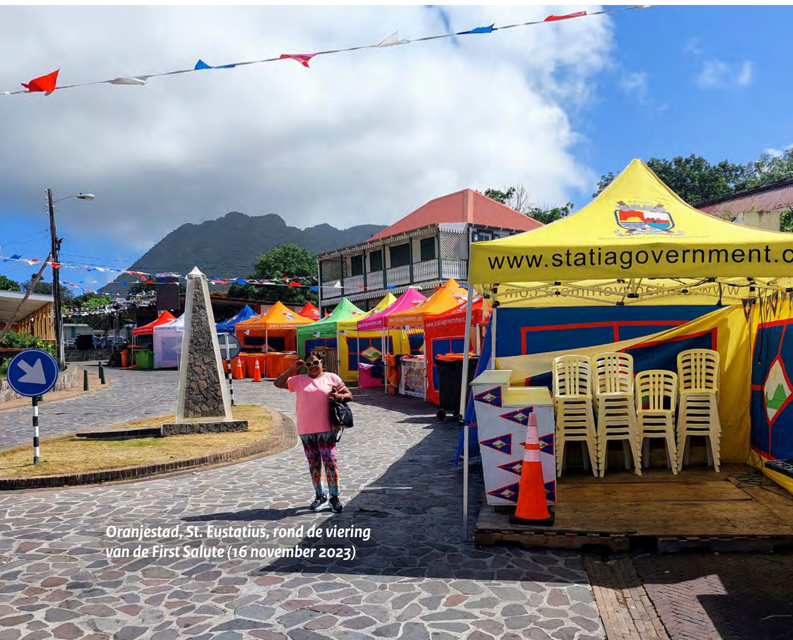
Oranjestad, St. Eustatius, rond de viering van de First Salute (16 november 2023)

Daarnaast is in de LoI afgesproken dat er 100 sociale huurwoningen worden gerenoveerd. 85 woningen zijn eigendom van het OLE, 15 woningen zijn eigendom van SHF. Voor de eerste tranche van renovatie van 20 sociale huurwoningen financieren BZK/VRO en het OLE elk €500.000.