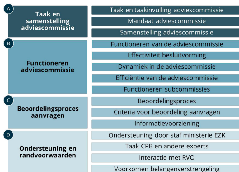
Figuur 1. Evaluatiekader

Begin juni zijn we van start gegaan met de evaluatie. Als startpunt voor de evaluatie van de adviescommissie hebben we een evaluatiekader opgesteld. Dit evaluatiekader geeft inzicht in de criteria en de onderliggende aspecten die we in de evaluatie aan de orde stellen. Daarmee biedt het een leidraad voor de verdere invulling van de evaluatie. De hoofdlijnen van het evaluatiekader zijn opgenomen in de onderstaande figuur.