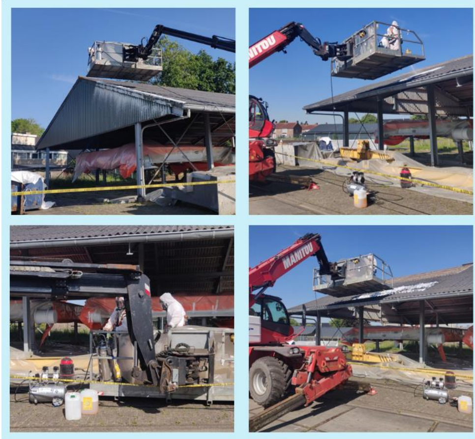
Figuur 4. Asbestverwijdering met schuim tijdens pilot