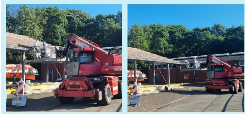
Figuur 3. Asbestverwijdering zonder schuim tijdens pilot

Het werken met adembescherming met luchtfilters en een asbestpak (werkkleding) brengt beperkingen met zich mee tijdens de uitvoering van de werkzaamheden en de productieve uren. Saneerders mogen maximaal 2 uur onafgebroken werken in een pak, waarna ze moeten douchen, zich omkleden en een uur pauze moeten nemen. Dit resulteert in een werkdag van 8 uur, waarin 6 uur wordt besteed aan het verwijderen van asbesthoudend materiaal.