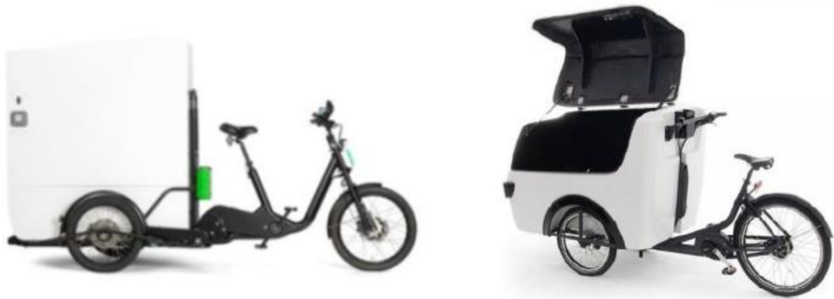
Figuur 2. Voorbeelden e-cargobike (Rijkswaterstaat WVL, 2022)

In april 2023 zijn er twee nieuwe categorie 2a LEV's toegelaten tot de openbare weg: de Stint Cargo en de Stint Pickup (zie Figuur 3). Ook deze LEV's worden breed ingezet: door de facilitaire dienstverlening, gemeenten, de recreatiesector, transport & logistiek en schoonmaakservices (Stichting Veilig door het Verkeer, 2023). De Stint Cargo wordt gebruikt voor pakketbezorging (Last Mile Delivery), maar ook voor bijvoorbeeld service- of onderhoudswerk in de binnenstad (Stint Urban Mobility, 2023b). Ook de Stint Pickup kent vele toepassingen, bijvoorbeeld afvalinzameling, groenvoorziening en onderhoud in de binnenstad (Stint Urban Mobility, 2023c). Naast op de openbare weg is het ook toegestaan om met de Stint Pickup te rijden op eigen terrein, bijvoorbeeld voor groenvoorziening en huishouding op vakantieparken en voor werkzaamheden op het gebied van schoonmaak, service en onderhoud op eigen terrein (Stint Urban Mobility, 2023d).