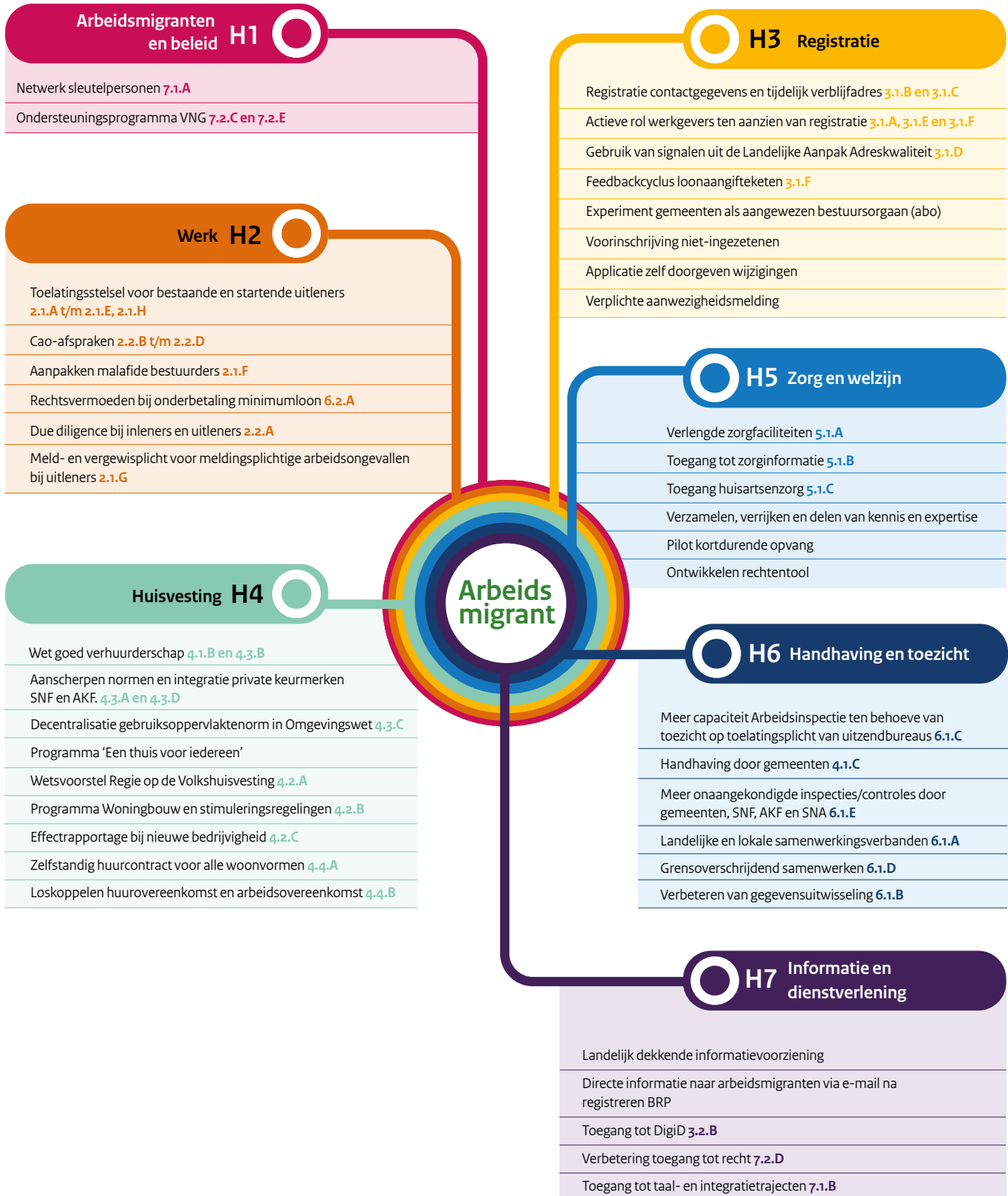
Figuur 1 Overzicht maatregelen per thema.