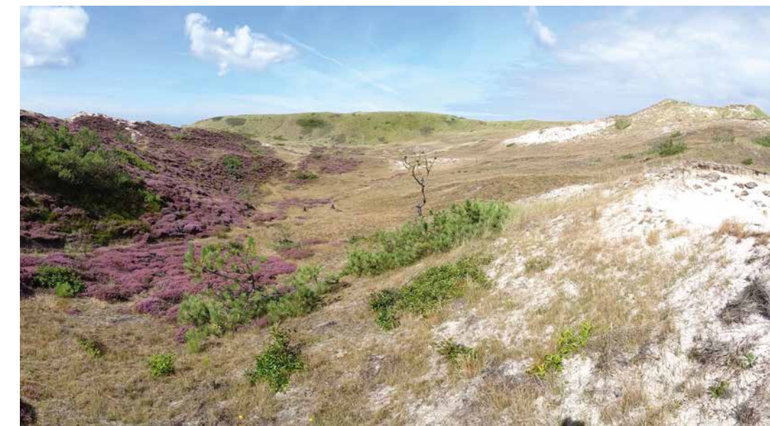
Foto 3. Het habitattype duinheiden met struikhei (EUNIS N19, habitattype 2150) in het Camperduin, onderdeel van het Natura 2000-gebied Schoorlse duinen.

In Zwitserland zijn in een stikstofgradiënt (5-37 kg N/ha/jaar) de effecten van stikstof op montane graslanden (EUNIS R23; habitattype H6520) onderzocht. De critical load werd in 2011 op basis van een deskundigenbeoordeling vastgesteld op 10 à 20 kg N/ha/jaar. Uit de gradiëntstudie blijkt dat er rond een depositie van 15 kg N/ha/jaar een omslag plaatsvindt, waarbij karakteristieke voedselarme soorten worden vervangen door minder tot niet kenmerkende voedselrijke soorten (figuur 1). Mede op basis van deze gradiëntstudie is de bandbreedte van de critical load voor montane graslanden bijgesteld naar 10-15 kg/ha/jaar, waarbij de betrouwbaarheid is aangepast naar vrij betrouwbaar.