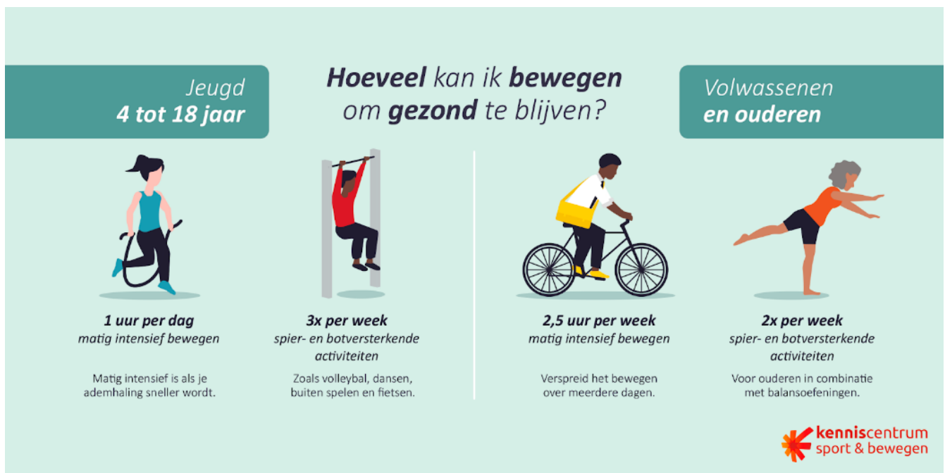
Figuur 1 De beweegrichtlijnen (Kenniscentrum Sport & Bewegen)

Volgens deze richtlijnen bewoog in 2022 nog niet de helft van de Nederlanders van vier jaar en ouder voldoende. Daarnaast brengen Nederlanders van 4 jaar en ouder dagelijks gemiddeld 9 uur zittend door 2 . Onderzoek van het RIVM 3 laat bovendien zien dat, bij gelijkblijvend beleid, Nederlanders in de toekomst niet meer zullen bewegen dan nu. Bovendien zijn er tussen groepen in de samenleving zijn grote verschillen te zien in beweeggedrag.