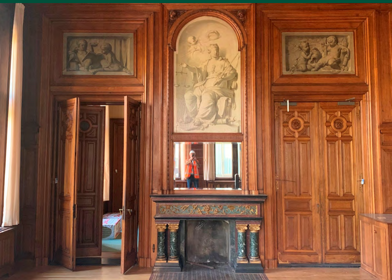
Afbeelding 1 Schilderij in een van de gebouwen van de Tweede Kamer op het Binnenhof.