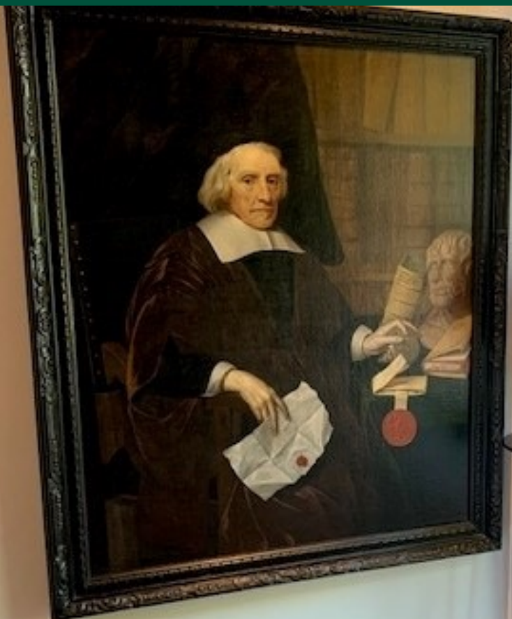
Afbeelding 3 Een schilderij uit de rijkscollectie in beheer van het ministerie van Algemene Zaken. Afgebeeld is Jacob Cats.