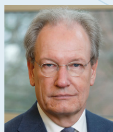
Harm Trip Lid