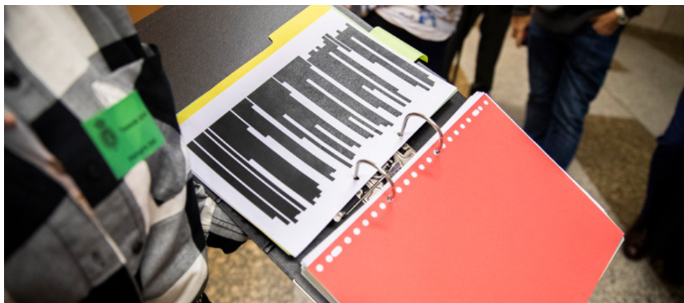
Foto 6. Een gedupeerde van de toeslagenaffaire laat een zwartgelakt dossier zien.

Ondanks de conclusie dat het narratief over een 'kwaadaardige elite' waarschijnlijk op lange termijn een ernstige dreiging vormt voor de democratische rechtsorde, is er door de aard van het narratief en de gevolgen hiervan slechts deels sprake van een zaak waar politie of justitie iets mee kunnen. Vrijheid van meningsuiting en persvrijheid spelen hier ook een belangrijke rol in. Strafrechtelijk ingrijpen is daarom lang niet altijd mogelijk en kan juist het narratief, en de dreiging die ervan uitgaat, versterken. Dit maakt dat de weerbaarheid in de samenleving tegen dit narratief des te belangrijker is. Het is belangrijk dat de samenleving het narratief herkent en onderkent dat het feitelijk onjuist is.