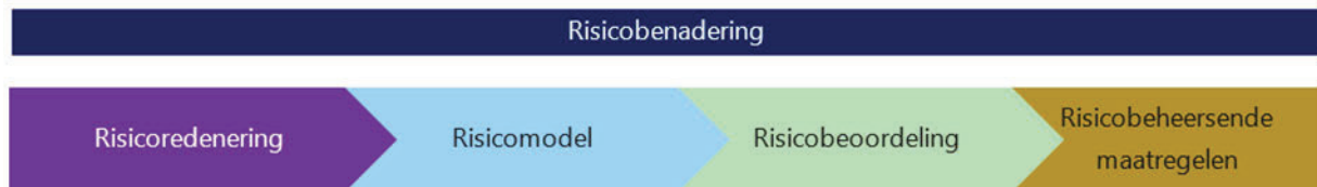
Figuur 1 Opbouw risicobenadering

Het onderbrengen van overwegen gelegen in havens of op industrieterreinen in een soortgelijk model wordt nu onderzocht, waarbij aangemerkt moet worden dat door een sterk verschillende spoorse situatie, het volgens dezelfde methode onderbouwen lastig blijkt te zijn. In april is hier een advies over uitgebracht, en heeft ProRail opdracht gegeven dit verder uit te werken.