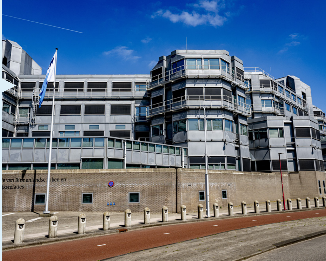
Het hoofdkantoor van de AIVD.

Voor inlichtingen- en veiligheidsdiensten in een democratische samenleving is toezicht en toetsing onmisbaar voor de legitimiteit van het werk. Het handelen van de AIVD wordt dan ook op verschillende manieren gecontroleerd. Onder meer parlementair, en incidenteel door onafhankelijke instanties als de Algemene Rekenkamer.