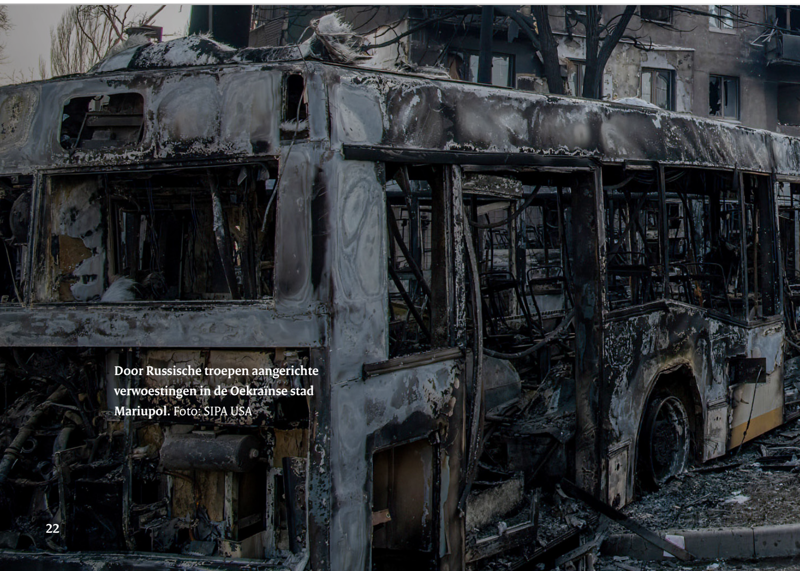
Door Russische troepen aangerichte verwoestingen in de Oekraïense stad Mariupol.