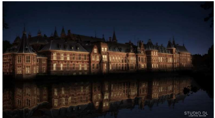
Impressie Aanlichting Hofvijverzijde Definitief Ontwerp, Studio DL Lighting Design