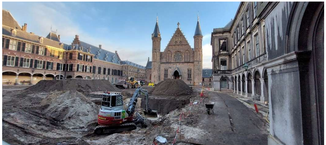
Werkzaamheden Opperhof

In de achtste voortgangsrapportage werd ingegaan op het starten van het ruimen van de kabels en leidingen op het Opperhof. Deze zijn in de tweede helft van 2022 geschoond of weggehaald. Tijdens deze werkzaamheden werd, in samenwerking met de gemeente Den Haag, archeologisch onderzoek verricht. De diverse vondsten geven de dienst archeologie van de gemeente Den Haag meer kennis over het verleden van het Binnenhof.