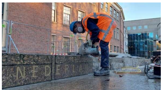
Loszagen van de grondwetbank