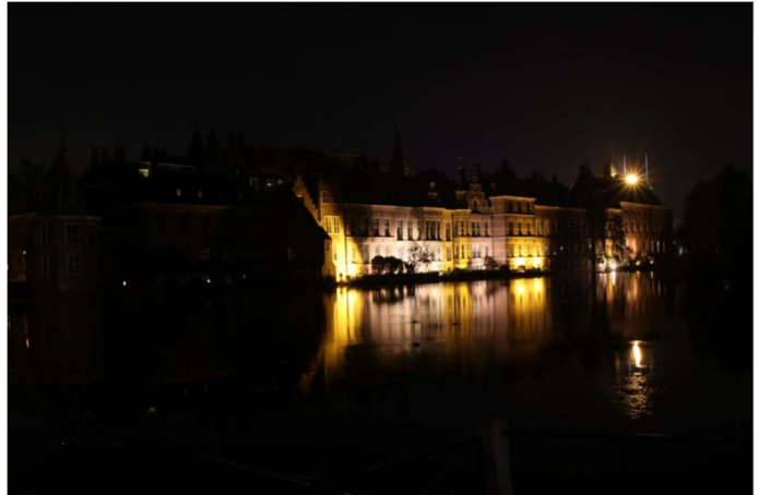
Huidige aanlichting Hofvijverzijde

De buitenverlichting van de complexdelen is zeer verouderd en niet duurzaam. Vervanging is daarom noodzakelijk. In de rapportageperiode zijn de plannen voor de buitenverlichting en de aanlichting van de Hofvijverzijde afgerond. In overleg met de gemeente is ervoor gekozen om de buitenverlichting van het Binnenhofcomplex aan te laten sluiten bij de reeds vervangen buitenverlichting van andere gebouwen in de directe omgeving, het Museumkwartier. De vergunning voor het aanlichten van de Hofvijverzijde van het Binnenhofcomplex wordt op korte termijn aangevraagd. De realisatie van de buitenverlichting aan de Hofvijverzijde van het complex zal zo spoedig mogelijk na toekenning van de vergunning plaatsvinden om bij te dragen aan een zo aantrekkelijk mogelijk beeld op het Binnenhof voor bezoekers van de Haagse binnenstad.