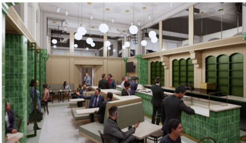
Artist Impression Statencafe, Berns en de Architekten Cie