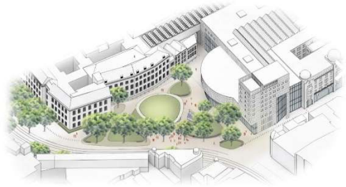
Artist Impression Ontwerp Publieksentree TK, De Architecten Cie & Karres en Brands Publieksentree