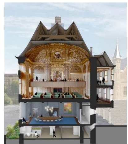
Impressie renovatie Eerste Kamer, BiermanHenket

Voorafgaand aan de start van de uitvoeringsfase die voor het gebouwdeel Eerste Kamer is voorzien vanaf 2025 moet de huidige staat van het pand goed zijn geanalyseerd. Om de exacte staat van onder meer vloeren en wanden te kunnen bepalen zijn afgelopen periode tientallen kleine gaten geboord om de opbouw van wanden en vloeren en daarmee ook de stevigheid van de constructie in kaart gebracht. Dit alles gebeurt zorgvuldig in overleg met bouwhistorici.