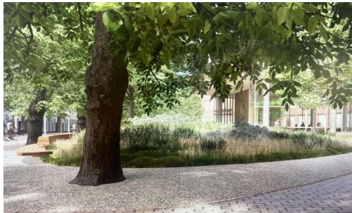
Artist Impression Ontwerp Publieksentree TK, De Architecten Cie & Karres en Brands Publieksentree