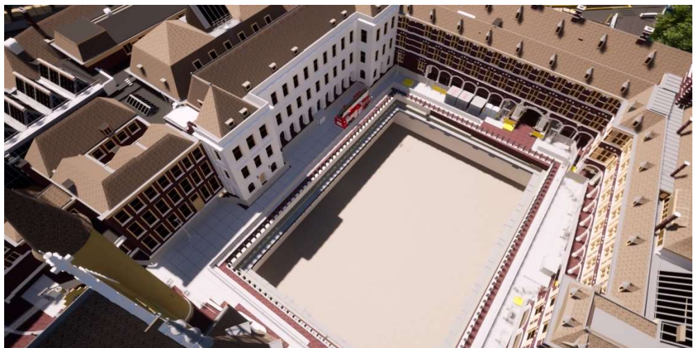
Impressie contouren technische hoofdinfrastructuur

Het realiseren van de THI is voorwaardelijk voor de oplevering van de gebouwdelen, omdat deze pas daarna kunnen worden aangesloten op de centrale energie- en veiligheidsvoorzieningen. Daarnaast hebben deze graafwerkzaamheden die niet met elektrisch materiaal kunnen worden uitgevoerd, stikstofuitstoot tot gevolg. Dit betekent dat andere werkzaamheden die ook stikstofuitstoot met zich meebrengen op een later moment plaatsvinden en niet meer gelijktijdig met de werkzaamheden voor de THI kunnen plaatsvinden. Bij de uitvoering komt dat, waar eerder het gelijktijdig uitvoeren van werkzaamheden een mogelijkheid bood om op schema te blijven, de beschikbare ruimte in en om het Binnenhof door onder meer het grote ruimtebeslag van de THI, beperkingen met zich meebrengt. Grote werkzaamheden kunnen niet gelijktijdig uitgevoerd worden en moeten volgtijdelijk plaatsvinden. Er zijn daarom geen verdere maatregelen meer te treffen om deze vertraging in te lopen. Deze toename van eisen en het ruimtegebrek zorgen voor een vertraging van circa 15 maanden. Zoals aangegeven in de achtste voortgangsrapportage is als beheersmaatregel de opdrachtverlening van de ruwbouw van de technische ruimte vervroegd. De splitsing van ruwbouw en de installaties en ringleidingen maakt dit mogelijk.