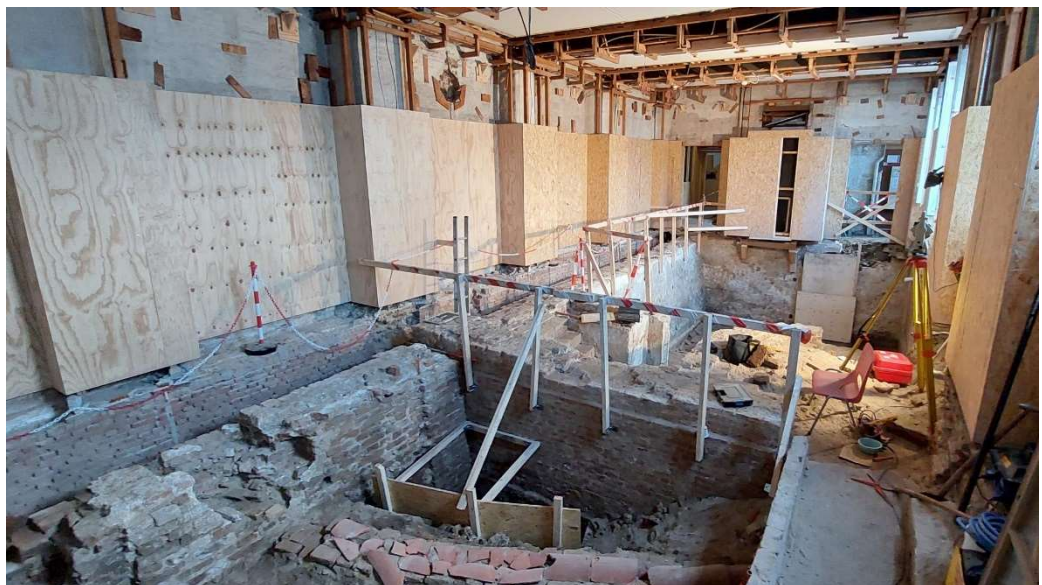
Kademuur in de Volle Raadzaal

In oktober 2022 zijn onder de voormalige Volle Raadzaal een kademuur (13 e /14 e eeuw) en een kelder (16 e /17 e eeuw) aangetroffen. De archeologische vondst maakt onderdeel uit van de onderzoeksfase van de renovatie. In een eerder stadium is het risico onderkend dat er meer oude restanten in de bodem aanwezig zijn dan wat op basis van beschikbare documentatie en oude tekeningen terug te vinden is. Daarom wordt er tijdens de onderzoeksfase in samenwerking met de Gemeente Den Haag archeologisch onderzoek uitgevoerd in en rond de huisvesting van Raad van State op het Binnenhof.