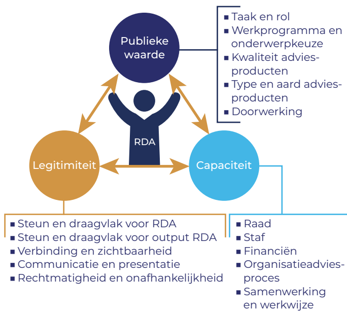
Figuur 1. Operationalisering evaluatiekader