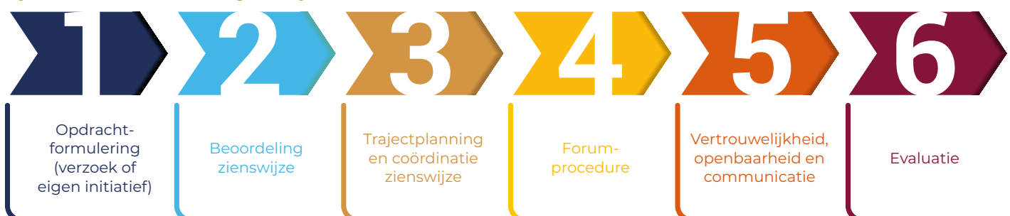
Figuur 3. Proces totstandkoming zienswijze.

De RDA werkt op verzoek op of eigen initiatief, dit is het onderdeel opdrachtformulering in het werkproces. In het geval van een adviesvraag vindt afstemming plaats tussen de secretaris en de verzoekende partij, meestal het ministerie van LNV, over planning, opleverdatum en samenhang met lopende trajecten.