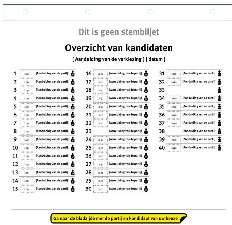
Schets van voorzijde van het overzicht van kandidaten

De namen en de nummers van de kandidaten kan de kiezer terugvinden in het Overzicht van kandidaten dat de kiezer voor de verkiezingsdag thuis krijgt, en dat tevens voor de kiezer in het stembokje beschikbaar is. In dat overzicht staan ook de overige gegevens van de kandidaten die op het huidige stembiljet staan, te weten voorletter(s), (eventuele) roepnaam, gemeente of woonplaats en eventueel geslacht. Verder staat op het overzicht, evenals op het stembiljet, bij elke partij het aantal kandidaten vermeld dat op de lijst staat. 15 De kiezer raadpleegt het Overzicht van kandidaten om na te gaan welk kandidaatsnummer hoort bij de kandidaat op wie hij wil stemmen. Hieronder staan twee schetsen afgebeeld van het Overzicht van kandidaten: een schets van de voorzijde van het Overzicht van kandidaten en een schets van een willekeurige pagina van een partij (hier: pagina 4, partij 4). Bij ministeriële regeling wordt een model voor dit overzicht van kandidaten vastgesteld.