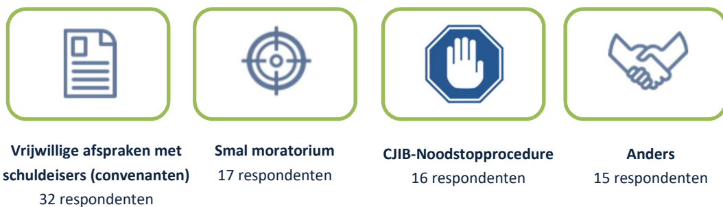
Figuur 4.2 Overzicht gebruik alternatieve instrumenten (N=48)

Binnen de ‘Anders’ optie geven 7 van de 15 respondenten aan dat er geen convenanten zijn gesloten, maar wel onofficiële vrijwillige afspraken met de schuldeisers zijn gemaakt (op basis van goede relaties).