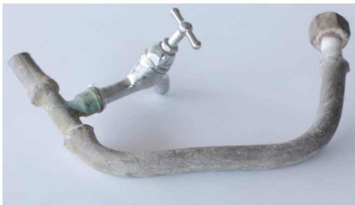
Figuur 3 : Loden leiding

Op 2 juli 2020 hebben de ministers van Binnenlandse Zaken en Koninkrijksrelaties, Infrastructuur en Waterstaat en van Medische Zorg in een gezamenlijke brief de Tweede Kamer verder geïnformeerd over welke acties er tot dan toe samen met diverse betrokkenen zijn ingezet en wat de (vervolg)aanpak inhoudt. In deze brief is voor de monitoring van lood in drinkwater onder meer aangegeven dat de reguliere monitoring door de drinkwaterbedrijven ook in de toekomst gebruikt wordt voor een globaal inzicht in de verdere ontwikkeling van de aanwezigheid van lood in drinkwater. Ook in deze rapportage is daarom een analyse van de individuele loodmetingen in 2021 opgenomen.