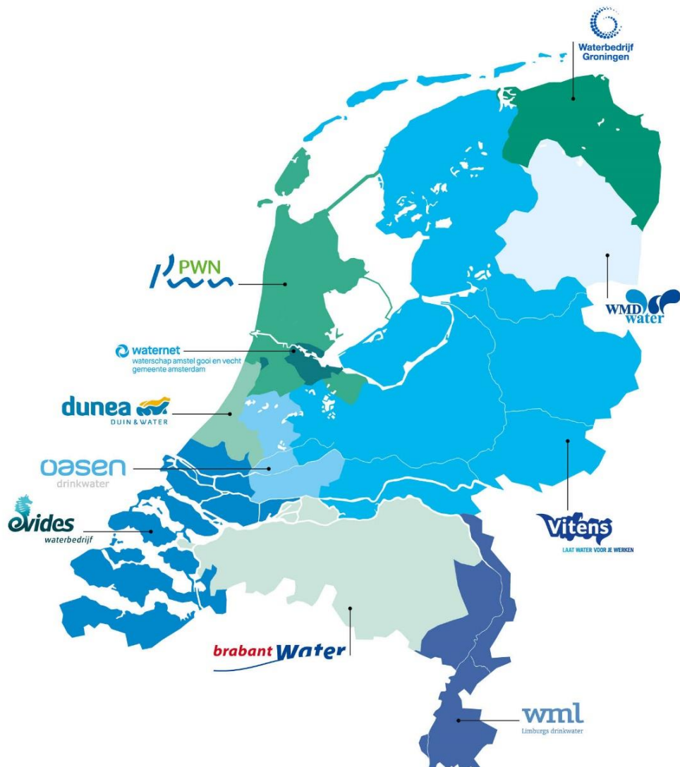
Figuur 1 : distributiegebieden van Nederlandse drinkwaterbedrijven (bron: Vewin)