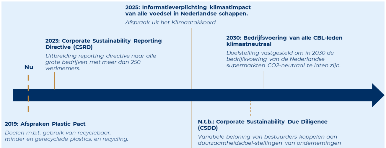
Figuur 3. Enkele aankomende (internationale) rapportageverplichtingen.

Het harmonisatieproces is een continu (internationaal) ontwikkelproces. Aansluiting en monitoring van ontwikkelingen in internationale rapportagestandaarden en -richtlijnen is van belang. Beleid op transparantie van duurzaamheidsrapportage dient aan te sluiten bij bestaande en toekomstige (Europese) standaarden, zoals de CSRD, de EU Code of Conduct on Responsible Food Business and Marketing Practices en CDDD. Vanaf 2023 verplicht de CSRD de bedrijven om veel strenger te rapporteren over duurzaamheidsdoelstellingen. Onderstaande figuur geeft een routekaart op hoofdlijnen van de (internationale) rapportageverplichtingen.