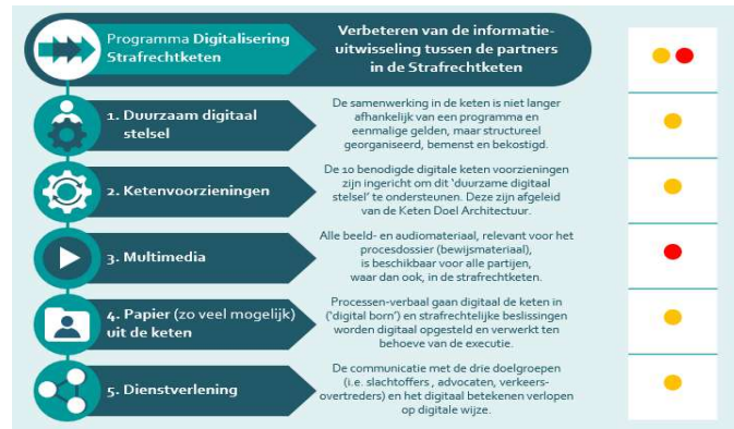
Stand van zaken van de vijf digitaliseringsdoelen

Samengevat zijn voor het digitaliseringstraject drie maatschappelijke doelstellingen voor het jaar 2021 vastgesteld. Het realiseren van deze doelstellingen zijn ondergebracht bij het programma PDSK met een looptijd tot en met 2022. De doelstelling op het gebied van dienstverlening aan de burger is tijdig bereikt. De andere doelstellingen zullen, zoals uit het voorgaande blijkt, in 2023 verder worden gerealiseerd. De 'overall' status van het digitaliseringstraject wordt daarmee gekwalificeerd als "oranje/rood".