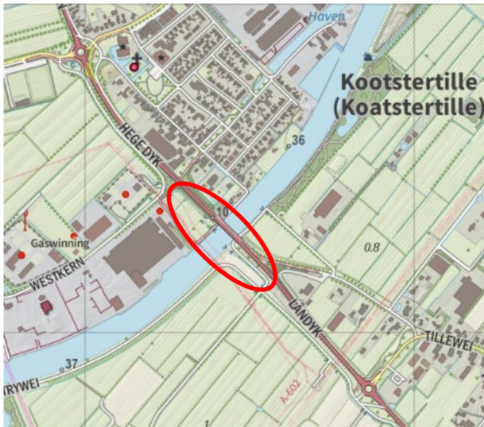
Figuur 1 Projectgebied verkenning Kootstertille

De rode cirkel in figuur 2 geeft een indicatie van het studiegebied. Dit studiegebied houdt in dat voor elk alternatief voor de oeververbinding Kootstertille kansen en gevolgen voor brug Schuilenburg in kaart wordt gebracht. Daarom is Schuilenburg opgenomen in het studiegebied en worden daarbij ook de effecten op verkeersnetwerk en sociaaleconomische effecten beschouwd.