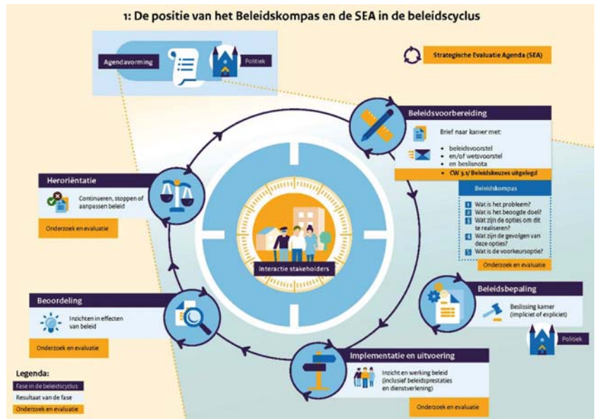
Figuur 2: Het Beleidskompas als onderdeel van de beleidscyclus

het versterken van de cultuur, systemen en processen voor goed ambtelijk handelen. 18 Hierbij wordt ingezet op een sterker ambtelijk bewustzijn van de impact van beleid op mens en maatschappij en het voeden van de nieuwsgierigheid naar andere maatschappelijke perspectieven.