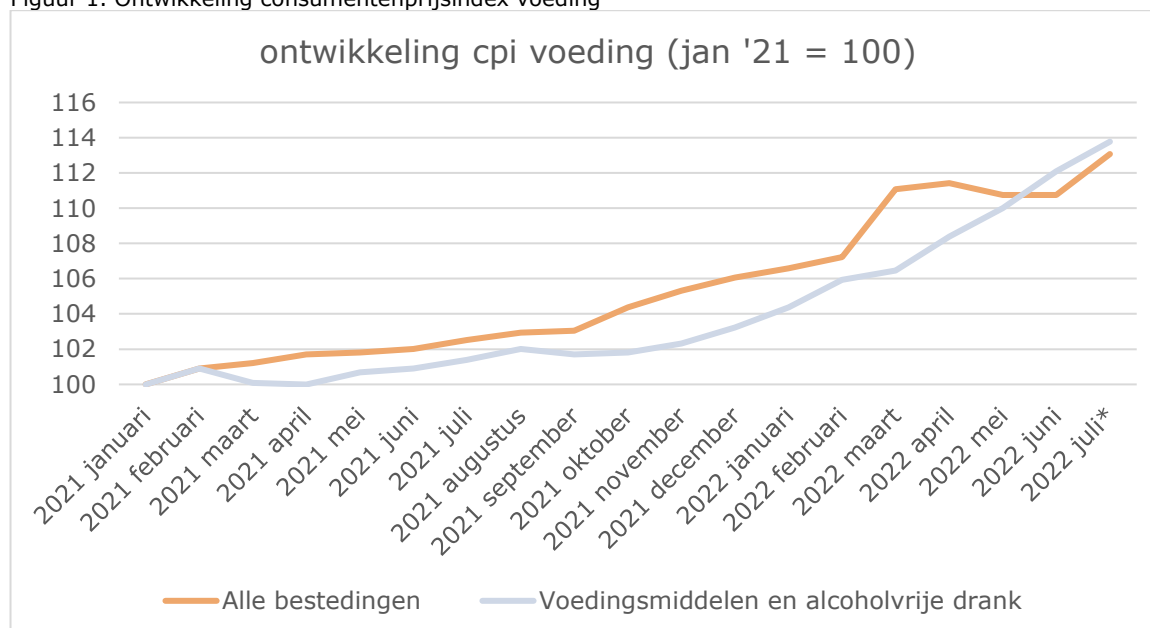
Figuur 1. Ontwikkeling consumentenprijsindex voeding

Toch ervaren ook uitwonende studenten de gevolgen van de hoge inflatie en worden zij net als andere huishoudens het hardst geraakt door de prijsstijgingen van energie en voeding. Onderstaande grafieken laten zien hoe de inflatie zich sinds januari 2021 heeft ontwikkeld: